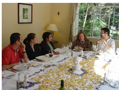
Encuentro de becarios y ex becarios SYLFF celebrado el 12 de noviembre en la ciudad de México