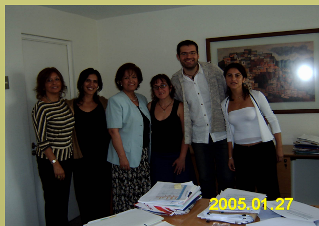
Encuentro con la comunidad SYLFF de Chile