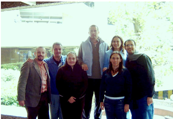
Integrantes de la comunidad SYLFF de El Colegio de México

Con mucho placer y entusiasmo les presentamos el primer número del Boletín de la Asociación SYLFF – El Colegio de México. Desde el año 2004, un grupo pequeño de estudiantes y recientemente graduados SYLFF nos reunimos para pensar el espacio de una Asociación que permitiera acercarnos. Acercar qué, concretamente? ¿Cómo hacer para aglutinar en una institución como El Colegio de México, a todos los ex estudiantes SYLFF que desde 1990 habían gozado de la beca? Y sobre todo, ¿Para qué? La última respuesta fue la primera que encontramos: habiendo nuevos programas para ex becarios, la División SYLFF de la Tokio Foundation se volvía un espacio de oportunidades potenciales que debíamos difundir de alguna manera, aglutinando esfuerzos en una Asociación de becarios y ex becarios. La segunda pregunta, el cómo, era más complicada de resolver. Para ello, hemos creado una página web que ustedes pueden visitar, y les traemos el primer número de este boletín informativo sobre las actividades y proyectos de la Asociación que ya cumple dos años de existencia. Por este medio, esperamos estar más conectados y construir un canal eficaz de comunicación